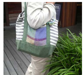
さをりトートバッグ 各 4,800 円(税抜本体価格) ネパール シャクティ・サムハ