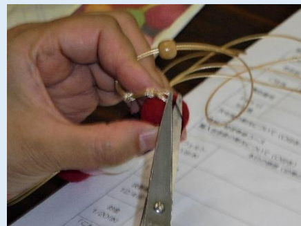
ネックレスづくりが始まりました。柔らかなフェルトボールにひもを通していきます。