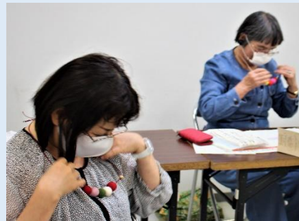
世界でひとつしかないネックレスです。みなさんよくお似合いです。

今後、1月までの毎月1回、ムーンライトセミナーを続けて開催します。私たちは、これらのセミナーの開催を通じて、地域活性化につながることを願っています。