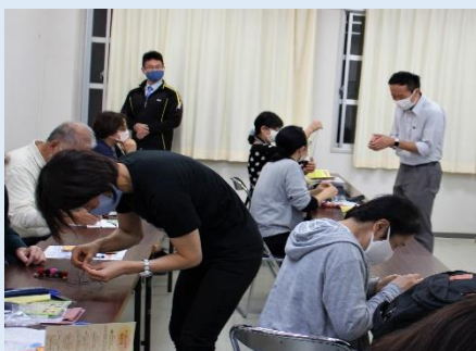
本校の先生方の応援もあって、最後の難関のところも助け合い乗り越えています。