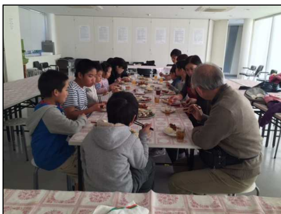
クリスマスパーティーの様子